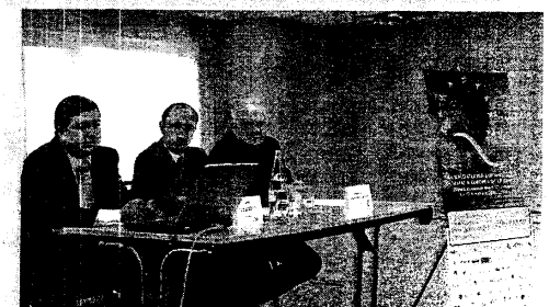
Eiken organiza un encuentro dentro de la Semana de la Calidad

Eiken Basque Audiovisual es una asociación de carácter profesional y sin ánimo de lucro, integrada por las principales empresas vascas dedicadas a la creación y emisión de contenidos, productos y servicios basados en el sector audiovisual. Su objetivo último es impulsar la transformación competitiva del sector. Desde 2004, año de su constitución, las empresas socias de Eiken han desarrollado una serie de acciones innovadoras en el sector enmarcadas en las cinco grandes áreas de su proyecto estratégico: la calidad y mejora de la gestión y formación, las nuevas tecnologías, la internacionalización, los contenidos y las infraestructuras audiovisuales.